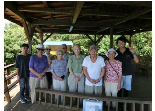
↑ままやカフェへドライブしました